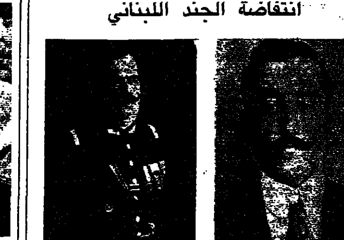
انتفاضة الجند اللبنانيين